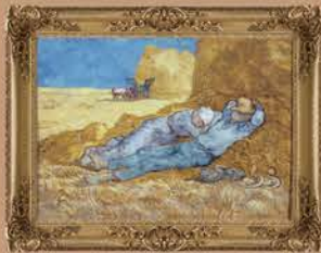
Artist : Vincent van Gogh Title : Noon, or The Siesta, after Millet, 1890 Medium : oil on canvas Dimensions : 73x91 cms Location : Musee d'Orsay, Paris, France