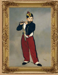
Artist : Edouard Manet Title : The Fifer, 1866 Medium : oil on canvas Dimensions : 161x97 cms Location : Musee d'Orsay, Paris, France